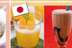
マンゴープリン 仙草ミルクティー