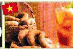
タマリンドジュース Nước me