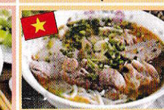
ブンボーフエ(フエの牛肉麺) Bún bò Huế