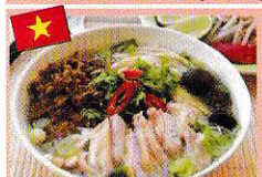
鶏とタケノコの春雨スープ Miếng Măng Gà