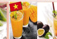
トロピカルドリンク Nước hoa quả