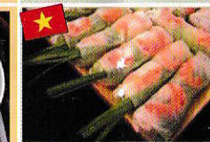
生春巻き Gỏi cuốn