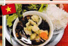
ブンチャー(焼肉入り米粉麺) Bún chả