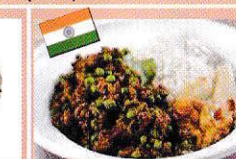
キーマカレーライス Keema curry