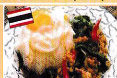
ガバオライス ผัดกระเพราไก่