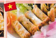
揚げ春巻き Nem rán