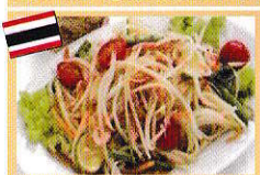
青パイヤサラダ(ソムナム) ส้มตำ