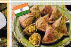
空心菜サモサ Water spinach Samosa