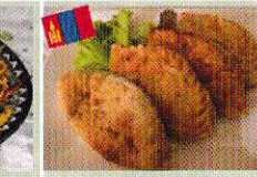
モンゴル揚げ餃子 ホーショール