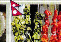
タンドリーチキン Tandoori Chicken