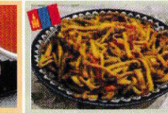
モンゴル焼きうどん ツォイワン