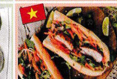
ホイアのバインミー Bánh mì Hội an