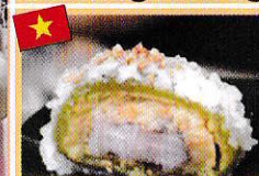
クック(野菜の名)おこわ xôi khúc