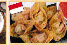
揚げワンタン Pangsit Goreng