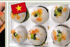
緑豆餡入り餅 Bánh ít Trần