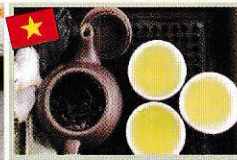
アーティチョーク茶 レモンガラス茶、他