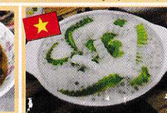
ココナッツのチャー Che dua non