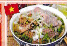
フォーボー(牛肉のフォー) Phở bò