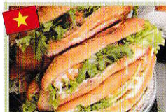
バインミー(サンドイッチ) Bánh mì