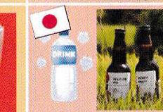
お茶・ジュースなど クラフトビール

インド India インドネシア Indonesia タイ Thai 日本 Japan モンゴル Mongolia ネパール Nepal ウクライナ Ukraine ベトナム Viet Nam