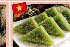
ライスケーキ xôi vi