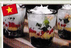
チャー(ベトナムのデザート) chè