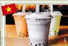
タピオカミルクティー trà sữa