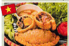
ベトナム揚げ餃子 Bánh gối