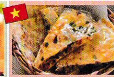
ライスパーピザ Bánh tráng nướng