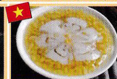
緑豆とタピオカのチャー chè đậu xanh bột bán