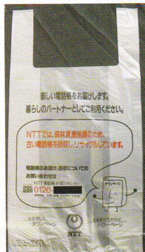
被害者の御遺体に付着していた NTT電話帳配布用のポリ袋