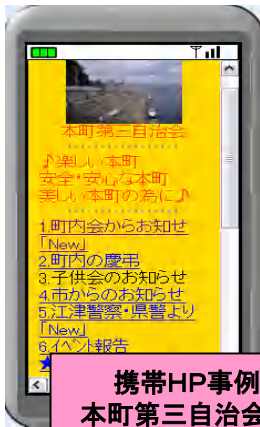
携帯HP事例 本町第三自治会殿