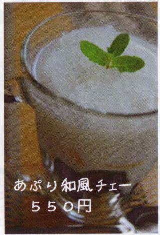
あぶり和風チー 550円