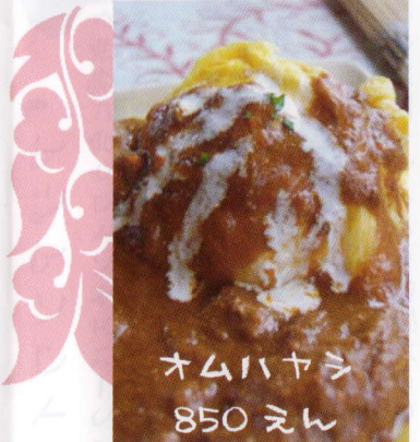
オムハヤシ 850 円